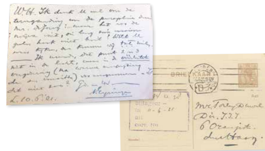
Amice, bedankt voor terugzending van de parapluie.

Het onderzoek in het archief was een belevenis op zich. Zwarte handen van de sigarenas en verroeste paperclips, een echo van een andere tijd en een ander ritme: verschillende postbestellingen op één dag ( Amice, bedankt voor terugzending van de parapluie door mr. de Jong, maar... het was de mijne niet, die lang zo'n mooien gele haak niet bezit! Wilt u eens kijken, dan kunnen wij t.z.t. ruilen ), en wie neemt er tegenwoordig nog persoonlijk contact op met de minister van Binnenlandse Zaken om met spoed even een telefoonaansluiting te regelen? 12 Of krijgt zomaar het volledige adressenbestand van De Nederlandsche Bank toegeschoven? Ook daar gaat dit boek over: van Amices en belangenverstrengelingen tussen regeringskringen en bedrijfsleven die nu vreemd aandoen, maar toen heel gewoon waren, naar een organisatie volgens de eisen van de huidige tijd.